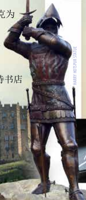
HARRY HOTSPUR STATUE